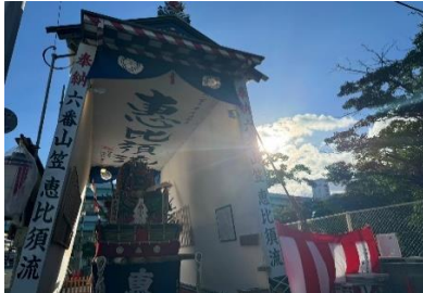
「山笠恵比寿流の朝日」