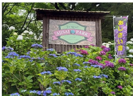
「天拝公園アジサイ園」