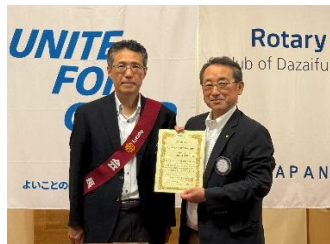
マイロータリー登録率100%達成賞