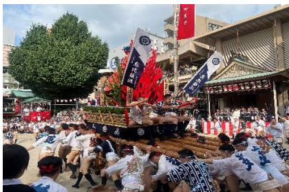
小柳会員恵比寿流台上がり