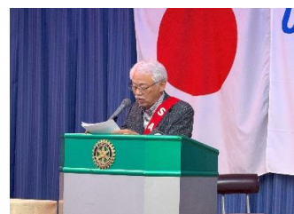
ニコニコ箱報告 時札正文君