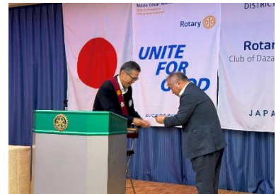
ポールハリスフェロー(PHF)