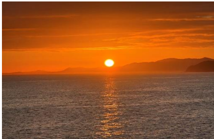
瀬戸内海船上の朝日