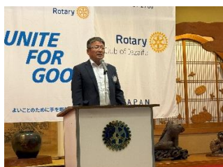
2024-25年度年報発行報告