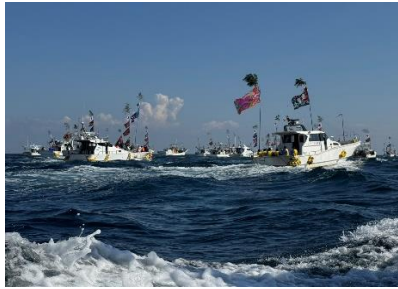
「玄海陽光、宗像みやれ祭」